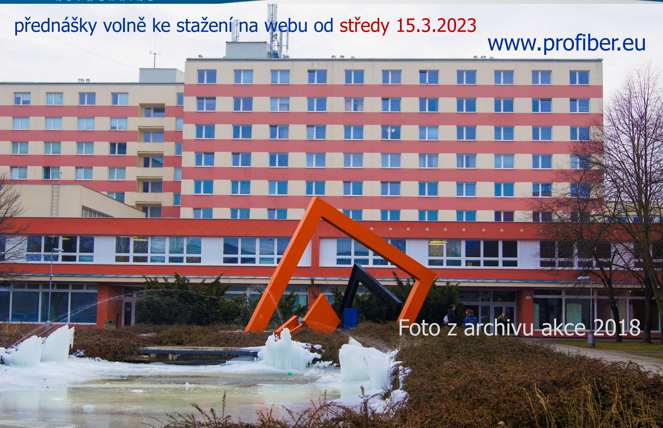
Foto z archivu akce 2018